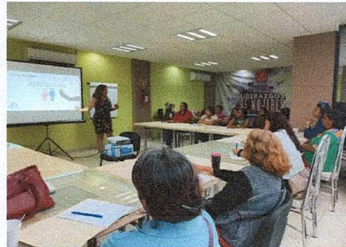
Chilpancingo de los Bravo, Guerrero, septiembre de 2023.