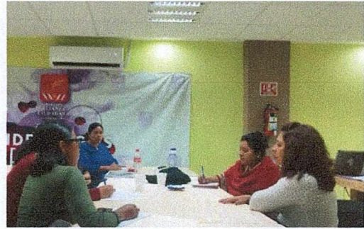
Chilpancingo de los Bravo, Guerrero, septiembre de 2023.