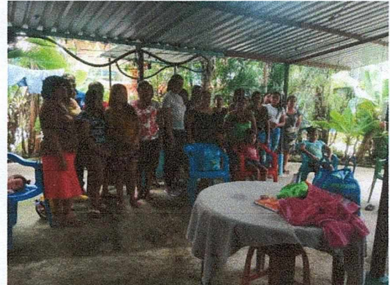
Tecoapana, Guerrero, Diciembre 2023

Por cuestiones presupuestales el resto de capacitaciones en las otras regiones no se pudieron llevar a cabo.