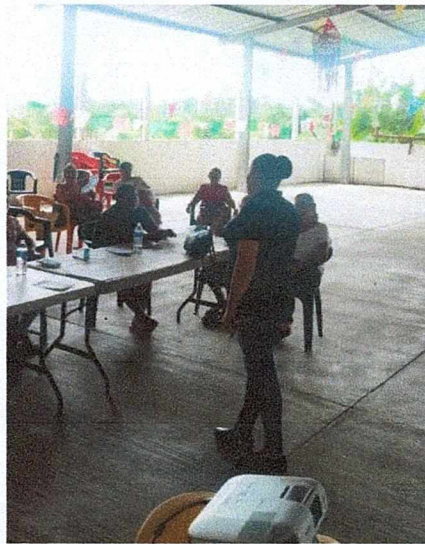
Marquelia, Guerrero, octubre de 2023.